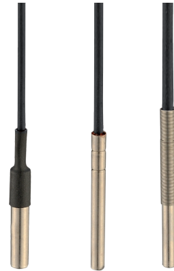
Beispiel für verfügbare Lösungen Example of available solutions